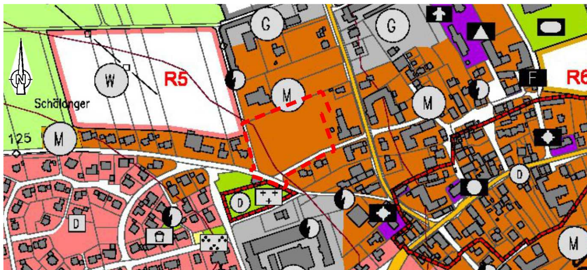
Derzeit rechtskräftiger Flächennutzungsplan (Planausschnitt, o.M.)

Darüber hinaus liegen der Gemeinde Riesbürg zahlreiche Anfragen von Bürger:innen vor, die ein privates Wohngebäude in Pflaumloch errichten möchten. Das Plangebiet „Stiegeläcker“ ist nahezu ringsum (mit Wohngebäuden) bebaut und eignet sich in idealer Weise zur städtebaulichen Nachverdichtung. Aufgrund der städtebaulichen Gemengelage und der tatsächlichen Nachfrage soll das Plangebiet nunmehr ausschließlich der Wohnnutzung dienen und dementsprechend als „Wohnbaufläche“ im Flächennutzungsplan ausgewiesen werden. Da das Plangebiet im derzeitigen Flächennutzungsplan als „Mischgenutzte Fläche“ enthalten ist, wird die vorliegende Flächennutzungsplanänderung erforderlich.